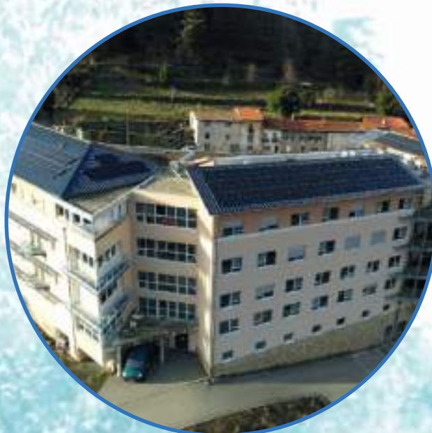
INSTALLATION DE PANNEAUX PHOTOVOLTAÏQUES