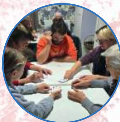
DE 10 À 82 ANS, TOUT LE MONDE JOUE !