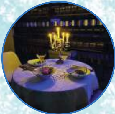
IMMERSION À BORD DU NAUTILUS