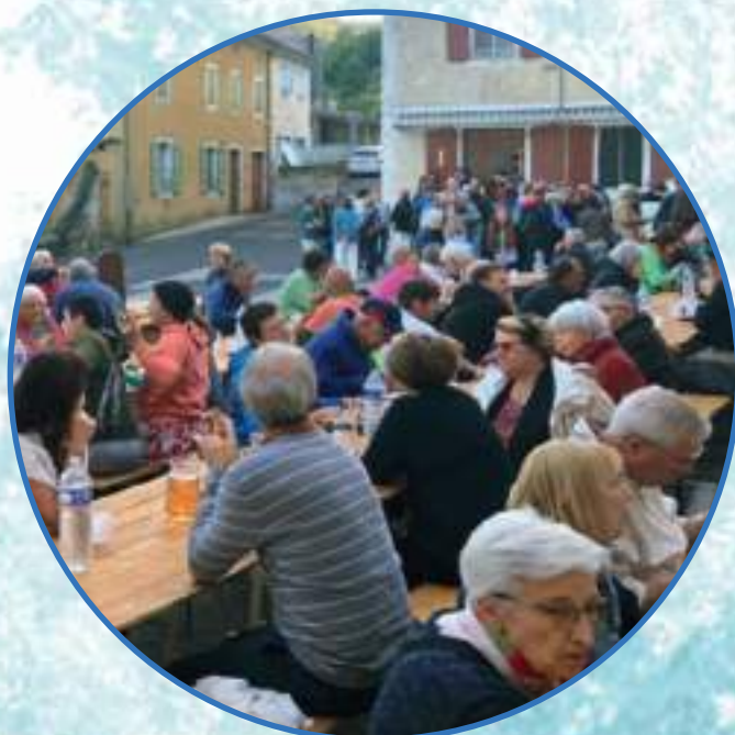
LA PLACE DU VILLAGE BIEN OCCUPÉE POUR DÉGUSTER LA BOMBINE !

Contents des résultats, nous avons aussitôt décidé d'organiser une soirée automnale à Gourjatoux avec au menu : charcuterie du plateau, soupe de courges accompagnée de châtaignes locales et un fromage blanc avec sa crème de marrons.