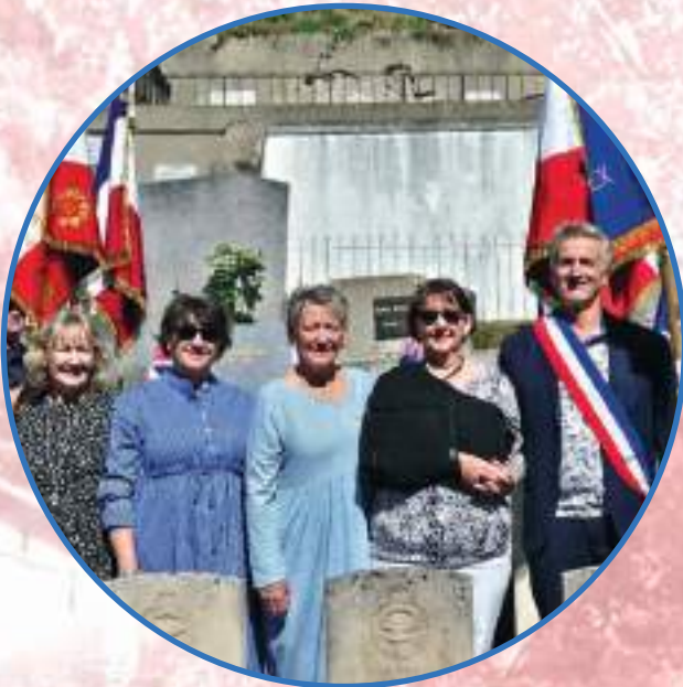
LES QUATRE NIÈCES TRÈS HEUREUSES ET ÉMUES LORS DE LA CÉRÉMONIE