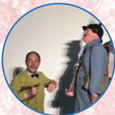
LE CONFÉRENCIER ET MARIUS