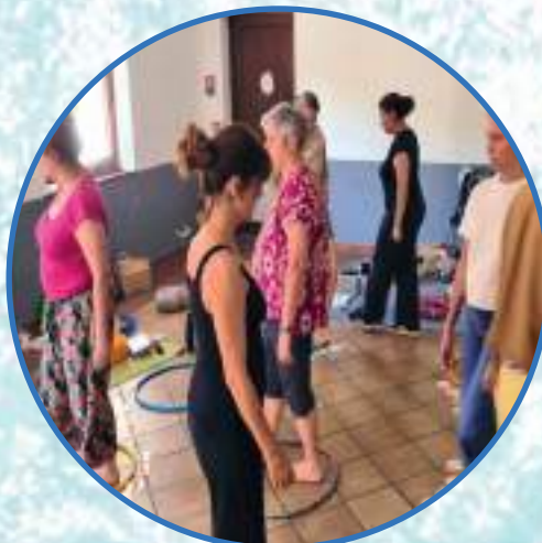
ACTIVITÉS ORGANISÉES AU CAMPING DE GOURJATOUX