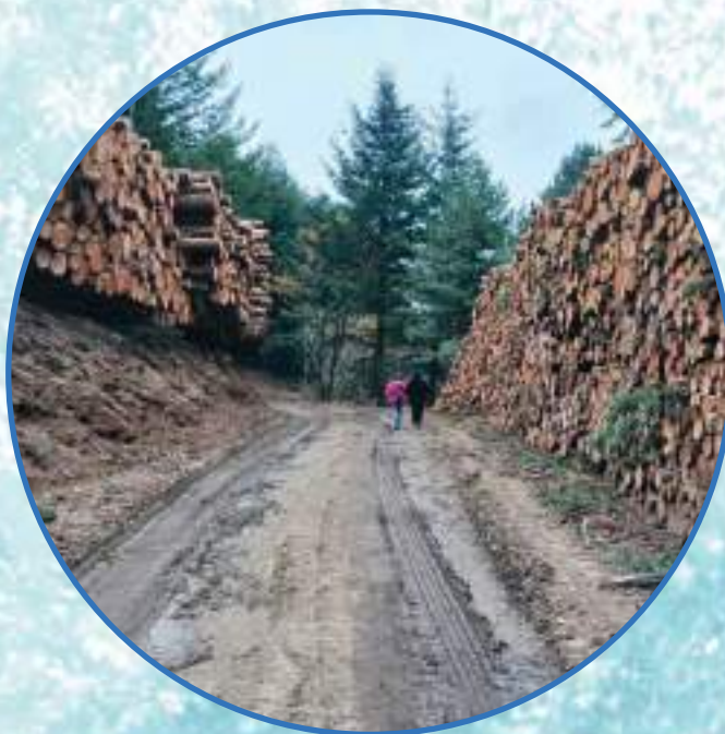
← UNE PARTIE DES BOIS EXPLOITÉS CES DERNIERS MOIS.