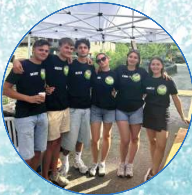
← L'ÉQUIPE DE L'AICG